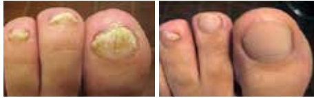
Starker Nagelpilzbefall der ersten 3 Zehennägel. Fast vollständige Abheilung acht Monate nach der Nagelpilz-Laseranwendung ohne Tablettengabe. Restverfärbung am 3. Nagel.

Beim Nagelpilz handelt es sich um eine ansteckende Erkrankung der Finger- oder meistens Zehennägel, die zu gelblicher Verfärbung bis hin zu völliger Zerstörung des Nagels führt. Bis vor Kurzem gab es als Therapiemöglichkeiten oftmals wirkschwache Cremes, Lacke oder Tabletten, die eine ganze Reihe schwerer Nebenwirkungen verursachen können.